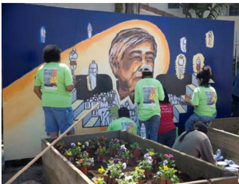
MURAL OF CESAR CHAVEZ